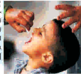
Կանխարգելման հիմնական միջոցը պատվաստումն է:

Կոչվում է (մանկական ողնուղեղային լուծանք): Սուր ընթացքով վարակիչ հիվանդություն է, որը բնորոշվում է առավելապես կենտրոնական նյարդային համակարգի ախտահարումով և կարող է առաջացնել հաշմանդամություն: Հարուցիչը շրջակա միջավայր է ընկնում հիվանդի արտաթորանքի հետ և փոխանցվում է սննդամթերքի, օրինակ՝ բանջարեղենի, մրգերի, ջրի, չեռացրած կաթի միջոցով: Հիվանդության բռնկումներն առավել հաճախ դիտվում են ամռան վերջերին և աշնան սկզբներին: Սպեցիֆիկ բուժում դեռևս չկա: