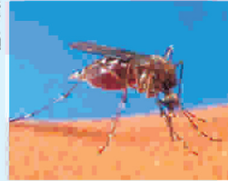
Կանխարգելման հիմնական միջոցը պատվաստումն է:

Սուր ընթացքով վիրուսային հեմոռագիկ (հեմոռագիա-արյունազեղում) հիվանդություն է, որը փոխանցվում է վարակված մոծակների միջոցով: Դեղին տենդի մահացությունը կազմում է 50%: Այդ հիվանդությունը տարածված է Աֆրիկայի և Լատինական Ամերիկայի արևադարձայն շրջաններում: Դեղին տենդ հիվանդության բուժման համար դեղամիջոց չկա: