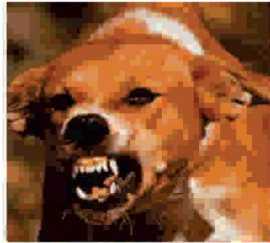
Կանխարգելման հիմնական միջոցը պատվաստումն է:

Վարակիչ մահացու հիվանդություն է, որը բնորոշվում է նյարդային համակարգի ծանր ախտահարումով, ջղածություն, լուծանքով, ինչպես նաև կլման և շնչառական մկանների կծկանքով: Մարդը վարակվում է կատաղությամբ հիվանդ կենդանու /շներ, կատուներ, ուղտեր, ձիեր, իսկ վայրի կենդանիներից՝ գայլ, աղվես, շնագայլ/ կծելուց, ինչպես նաև վնասված մաշկի, հազվադեպ՝ շրթունքների, քթի, աչքերի լորձաթաղանթների թքոտման դեպքում: Բուժումն անարդյունավետ է: