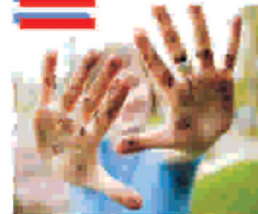
Կանխարգելման հիմնական միջոցը պատվաստումն է:

Սուր ընթացքով աղիքային ինֆեկցիա է, որը բնութագրվում է ինտոքսիկացիայով, յարդի և փայծախի մեծացումով, բարակ աղիների ավշային ապարատի ախտահարումով: Որովայնային տիֆով վարակվում են ֆեկալ-օրալ ճանապարհով (ջրով, սննդով) ինչպես նաև կենցաղային ճանապարհով: